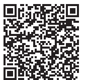
Inscription en ligne

Inscription en ligne dans l'espace " Mes Activités " du site internet de la CMCAS (paiement en ligne ou en CMCAS) ou bulletin d'inscription à retourner à la CMCAS accompagné de votre règlement par chèque. J'ai pris connaissance des conditions générales de vente, consultables sur le site de la CMCAS.